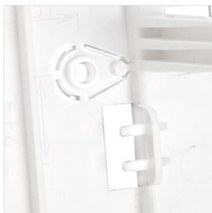
Miejsce na styk sabotażowy reagujący na oderwanie od podłoża