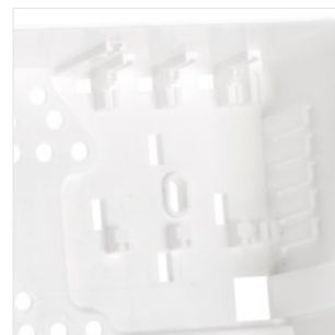
Uchwyt do montażu ekspanderów