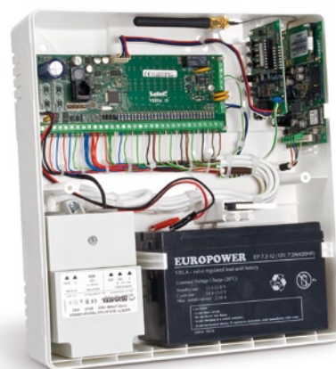
Przykładowa konfiguracja sprzętu do obudowy OPU-4 P