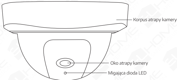
Rys.1. Budowa atrapy kamery monitorującej AK-09B3

Budowę atrapy AK-09B3 pokazano na rys.1. Na rys. 2 pokazano dokładne wymiary zewnętrzne atrapy.